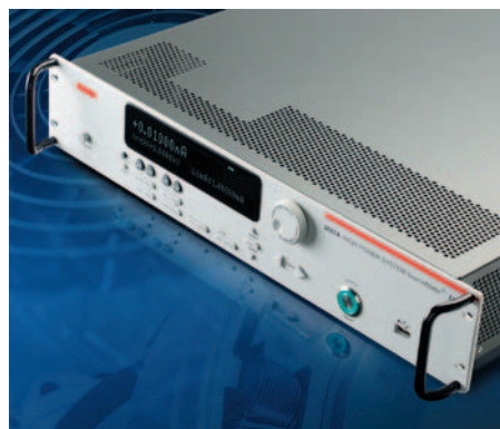
Рис. 1. Источник-измеритель SourceMeter модели 2657A предназначен для подачи высоких напряжений/малых токов и измерения характеристик силовых полупроводниковых приборов

Источник-измеритель 2657A работает в четырех квадрантах, то есть он может быть источником и потребителем тока и напряжения. Модель 2657A с максимальным выходным напряжением 3 кВ (рис. 2) может подавать или потреблять до 180 Вт постоянного тока ( \pm 3000 В при 20 мА, \pm 1500 В при 120 мА), что является самым высоким в отрасли уровнем мощности при таком высоком напряжении. Кроме того, прибор имеет разрешение 1 фА, что позволяет выполнять быстрые и точные субпикоамперные измерения очень малых