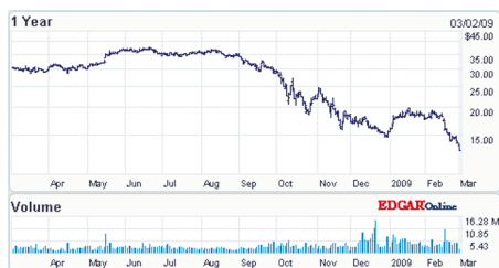
Рис. 1. Стоимость акций компании Agilent Technologies по состоянию на 2 марта 2009 г.

стоимость акций компании Agilent Technologies начала стремительно падать вниз после начала финансового кризиса. Так, с $36,14 за акцию в августе 2008 цена упала до $13,60 в марте 2009 года (рис. 1).