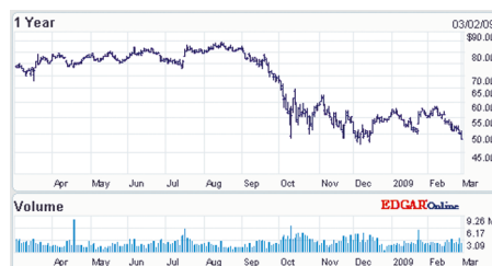
Рис. 3. Стоимость акций компании Danaher по состоянию на 2 марта 2009 г.

Как вы видите, финансовый кризис отразился на всех компаниях, работающих в области измерительного оборудования. Выживет сильнейший. ☹