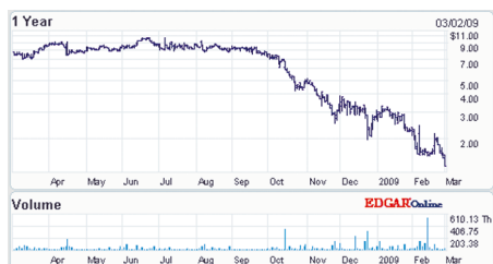
Рис. 2. Стоимость акций компании LeCroy по состоянию на 2 марта 2009 г.

Негативные последствия мирового кризиса не обошли стороной и такого игрока на рынке измерительной техники, как компания LeCroy ( www.lecroy.com ). В ответ на уменьшающийся спрос на продукцию LeCroy компания уже разработала программу по экстенсивному уменьшению издержек во втором квартале 2009 года, которая состоит из сокращения числа сотрудников (включая несколько управленческих и административных позиций), компенсаций,