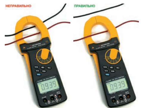
Охват проводника токовыми клещами

Это значение прямо пропорционально величине напряженности магнитного поля, созданного в магнитопроводе токовых клещей проводником с током.