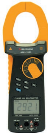
Токовые клещи АКТАКОМ ATK-2103

Классическим примером таких токоизмерительных клещей является модель АКТАКОМ ATK-2103.