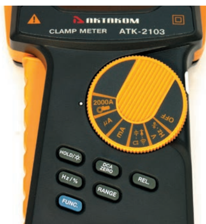
Органы управления токовых клещей АКТАКОМ ATK-2103

В-пятых, для увеличения точности показаний и исключения ошибки вызванной смещением постоянной составляющей в токовых клещах АКТАКОМ ATK-2103 имеется схема «установки нуля».