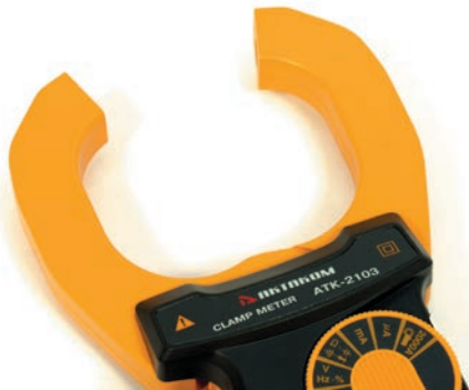
Магнитопровод токовых клещей

Для измерения тока без разрыва цепи используются электроизмерительные приборы, называемые токовыми (токоизмерительными) клещами. Эти приборы оснащены разъемным магнитопроводом, который открывается при нажатии на изолированные рукоятки, что позволяет охватить проводник с током и, таким образом, провести измерения тока без разрыва цепи.