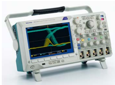
Рис.1. Осциллограф Tektronix DPO3054 на базе технологии DPO