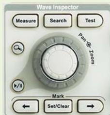
Органы управления на панели

Функция постановки меток (Mark) также помогает пользователю при навигации по памяти, хранящей сигнал. Кнопка установки/очистки метки (Set/Clear) помещает видимый символ маркировки в любой выбранной точке сигнала. Расположенные на передней панели кнопки Previous («Назад») и Next («Вперед») немедленно перемещают изображение от метки к метке. Это дополнительно облегчают навигацию.