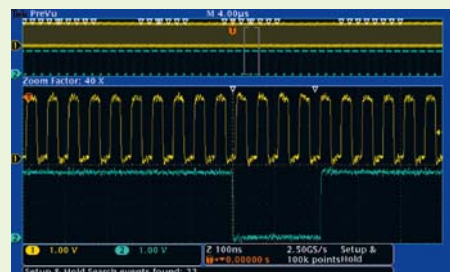
Перемещение по сигналу