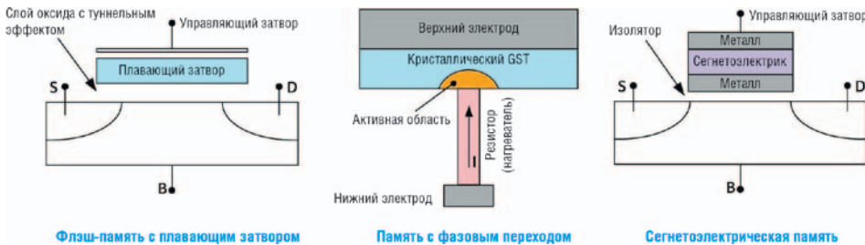
Рис. 1. Некоторые типы энергонезависимой памяти

Исследователи искали интегрированный подход, позволяющий при подаче импульса на запоминающее устройство или исследуемый материал одновременно измерять и ток, и напряжение. Такая возможность была и раньше, но эта методика требовала применения нескольких приборов и написания программы, координирующей их работу. При этом всегда приходилось искать компромисс между стоимостью, производительностью и сложностью. Обычно такие специализированные системы создавались и обслуживались собственными специалистами, которые обладали необходимым опытом, квалификацией и временем для объединения различных приборов в работоспособную измерительную схему. Как правило, такие «доморощенные» системы были рассчитаны на решение только одной задачи, отличались ограниченными возможностями, сложностью управления и длительным временем обработки результатов измерения 2 . Для измерения тока обычно использовалась образцовая нагрузка или резистивный датчик с осциллографом или дигитайзером. Этот метод хорошо проверен, но влияние нагрузки на напряжение, подаваемое на устройство, отрицательно сказывалось на результатах многих импульсных измерений. Кроме того, сопоставить результаты, полученные на разных системах, и обеспечить отслеживаемую калибровку на системном уровне было практически невозможно.