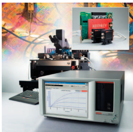
Рис. 2. Новейшие измерительные приборы, такие как параметрический анализатор Keithley 4200-SCS в сочетании с высокоскоростным модулем измерения вольт-амперных характеристик 4225-PMU, упрощают оценку электрических характеристик разрабатываемых устройств энергонезависимой памяти за счет одновременного измерения тока и напряжения при подаче точно контролируемых импульсов

К счастью, возможности новой измерительной техники (рис. 2) позволили одновременно измерять ток и напряжение одним прибором при подаче точно контролируемых импульсов. Новые инструменты предоставляют исследователям дополнительные данные, позволяя им лучше понимать поведение материалов или устройств энергонезависимой памяти за меньшее время. Подача импульсов при одновременном измерении тока и напряжения с высокой частотой выборки позволяет глубже проанализировать электрические и физические явления, определяющие поведение памяти. Возможность измерять не только характеристики по постоянному току, но и переходные процессы позволяет получить фундаментальные сведения о свойствах материала и реакции устройства на различные сигналы.