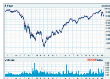
Рис. 2. Стоимость акций компании Agilent Technologies

В обращении к акционерам от 19 января 2010 года, CEO компании Agilent Technologies ( www.agilent.com )