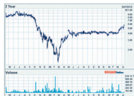
Рис. 3. Стоимость акций компании LeCroy

Выручка LeCroy в третьем финансовом квартале 2010 года составила $33,6 миллиона, по сравнению с $31 миллионами во втором квартале и $26,9 млн. за аналогичный квартал 2009 года. Компания объявила, что валовая прибыль, исчисленная по стандартам GAAP, составила 59,8%, тогда как операционный доход компании