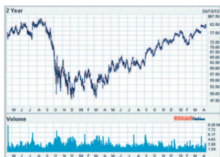
Рис. 1. Стоимость акций компании Danaher

22 апреля 2010 года корпорация Danaher ( www.danaher.com ) сообщила в своем финансовом отчете за первый квартал 2010 года, что чистая прибыль компании (GAAP) по состоянию на конец первого квартала — 2 апреля 2010 — составила $300.2 миллиона, по сравнению с $237,7 миллионами годом раньше. Продажи компании за первый квартал составили $3.1 миллиарда, что на